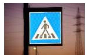
panneau rétro illuminé

En espérant que nos produits répondront à vos attends, nous sommes à votre disposition pour tous renseignement complémentaires.