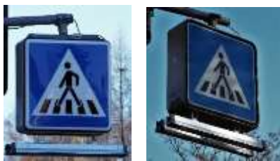
Remplacement des sources lumineuse NAV / NAV-T par des barres à LED's