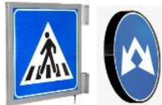
Simple ou double face